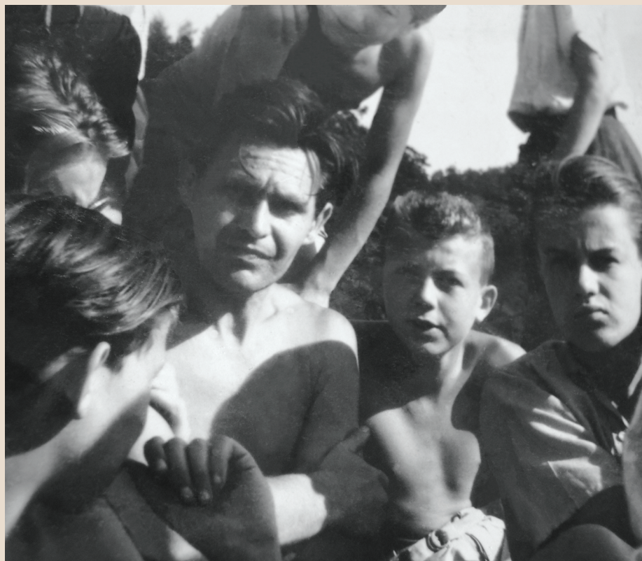
Ustaraný Jestřáb s chlapci na fotografii z oddílové kroniky 1943/1944.

Při takhle rychlé jízdě se ovšem ztrácí množství zásadních životních okamžiků. Uvědomme si, že Foglarovi je cca 33 až 38 let a je na vrcholu svých sil. Do hry se tak s naší knihou vrací i řada důležitých osobností, které s Foglarem pravidelně přicházely do pracovního styku a spolu- vytvářely jeho životní okolnosti.